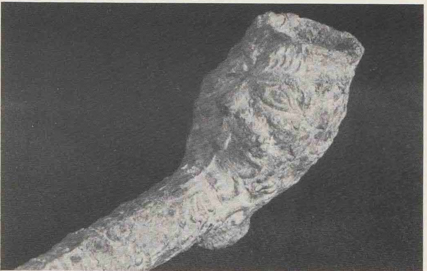
Tinnen SWR/Jonas-pijp uit Sainte-Marie among the Hurons (Can.)

De pijp is gemaakt van een metaallegering op loodbasis, waarschijnlijk tin. De lengte van de pijp is 36 cm en de diameter van de kop, met een grote vlakke hiel, is 1,4 cm. De steel is tot de helft gedecoreerd. Zowel op de kop als de steel zijn vormnaden aanwezig. De pijp is dus uit een mal afkomstig en er bestaan mogelijk nog meer exemplaren. De korte periode waarin het grafveld gebruikt werd, maakt een nauwkeurige datering mogelijk: deze ligt tussen 1642 en 1649.